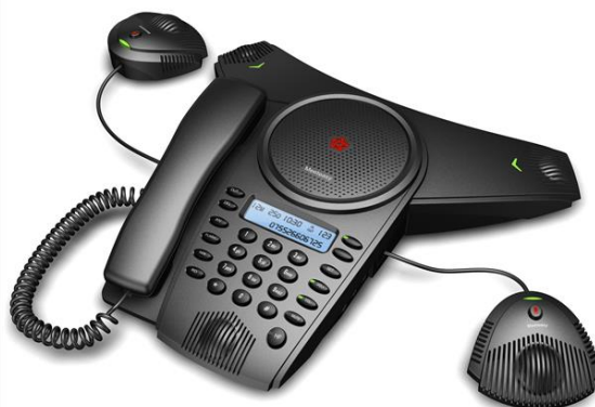
Meeteasy® Mid2 EX